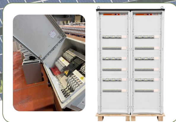
■ BJ (Boîtes de Jonction) et ARDC (Armoires de Regroupement DC)