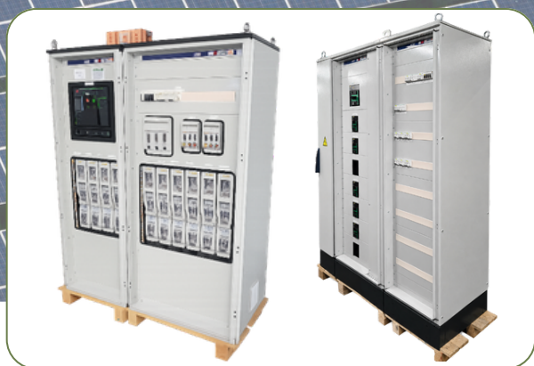
■ AGBT (Armoires Générales Basse Tension)