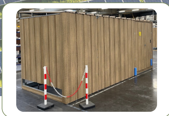
■ Développements spécifiques

Notre gamme Grands Projets s'adresse aux installations de grande envergure. Conçue pour maximiser l'efficacité énergétique à grande échelle, elle garantit des performances optimales tout en répondant aux défis techniques les plus complexes.